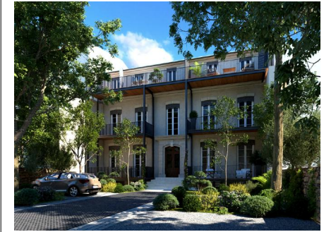
IMMEUBLE PIERRE SÉMARD