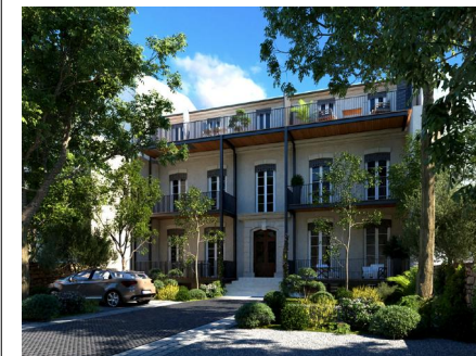
IMMEUBLE PIERRE SÉMARD