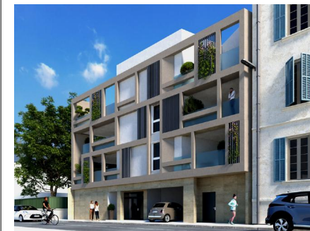
IMMEUBLE NOTRE DAME