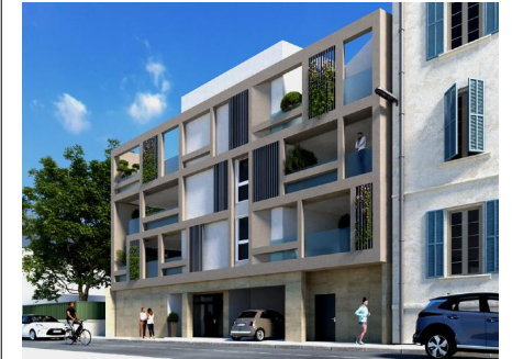
IMMEUBLE NOTRE DAME